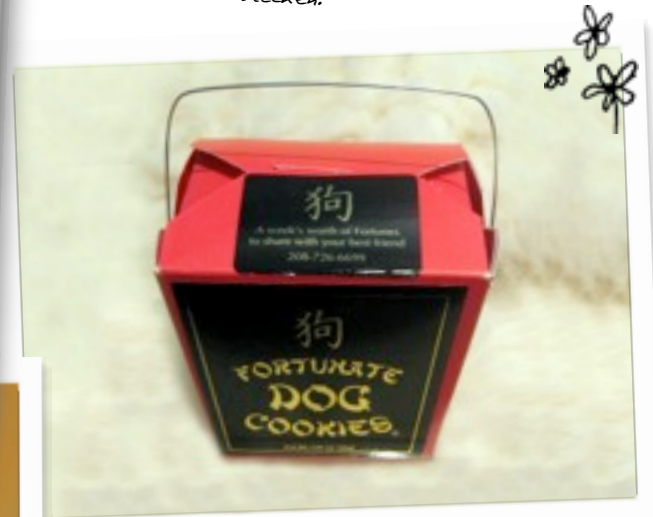
Tolle Geschenkidee mit kleinem Spruch, speziell für Hunde – eine witzige Idee.