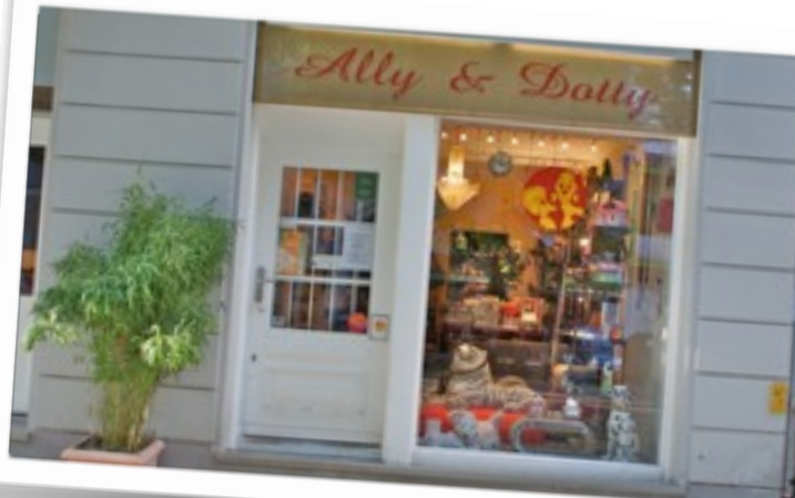
Bei Ally and Dotty in der Pariserstraße in Berlin gibt es immer etwas zu entdecken.